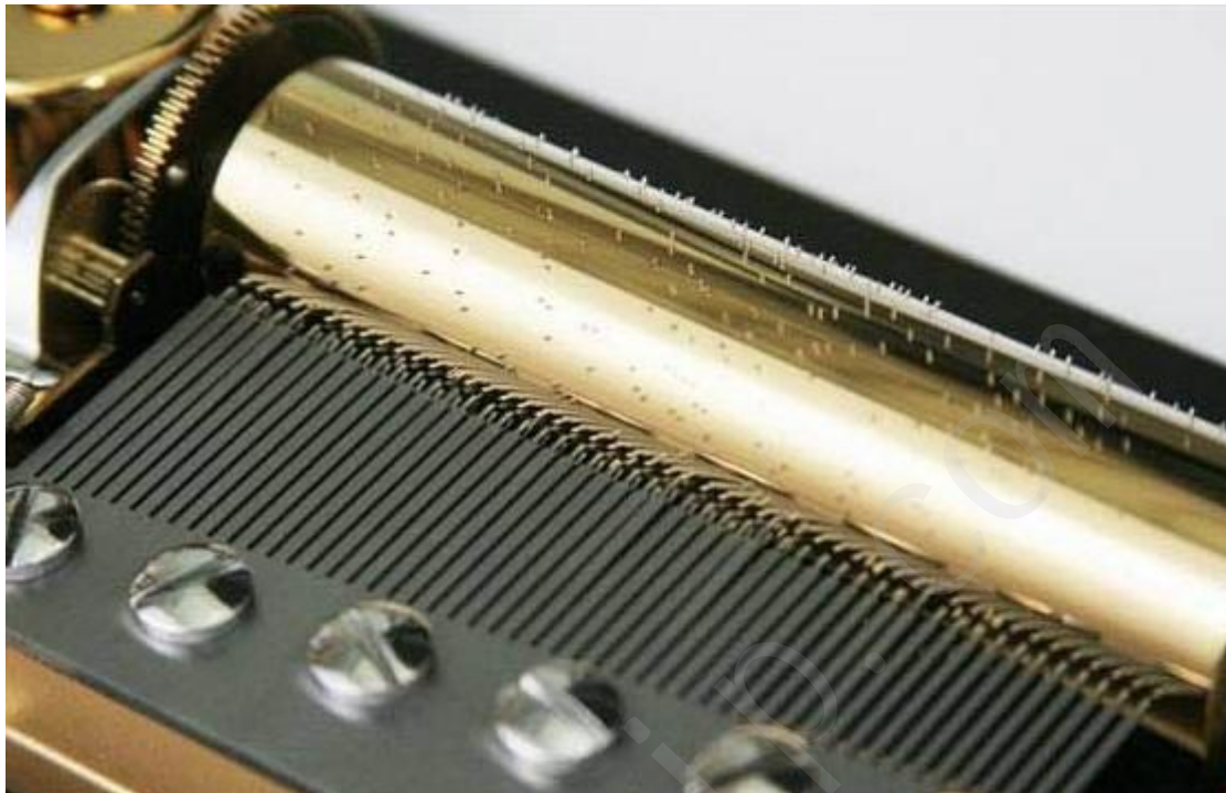
▲ 圣诞音乐盒的机芯示意

相当于乐谱, 每当滚筒转动时, 这些小凸点就会拨动"梳子"芯片, 产生震动, 从而发出声音。